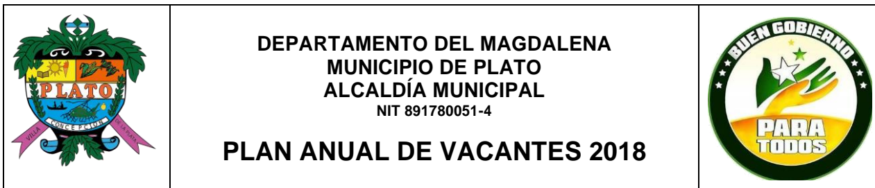
Tabla No. 1 PLANTA DE PERSONAL DEL MUNICIPIO DE PLATO MAGDALENA Año 2018