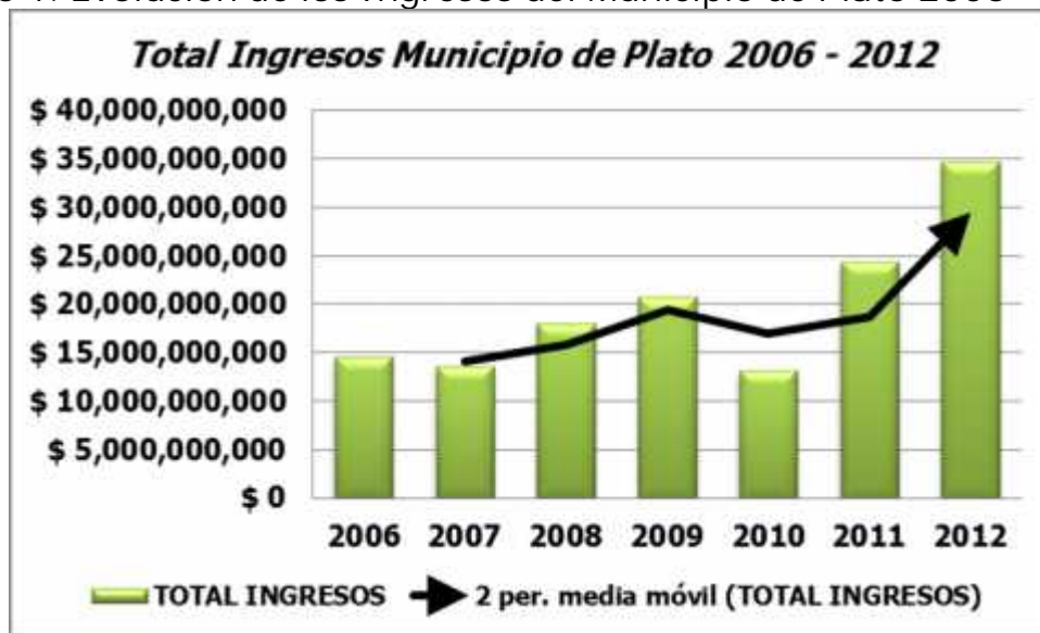
Grafico 1. Evolución de los Ingresos del Municipio de Plato 2006 – 2012